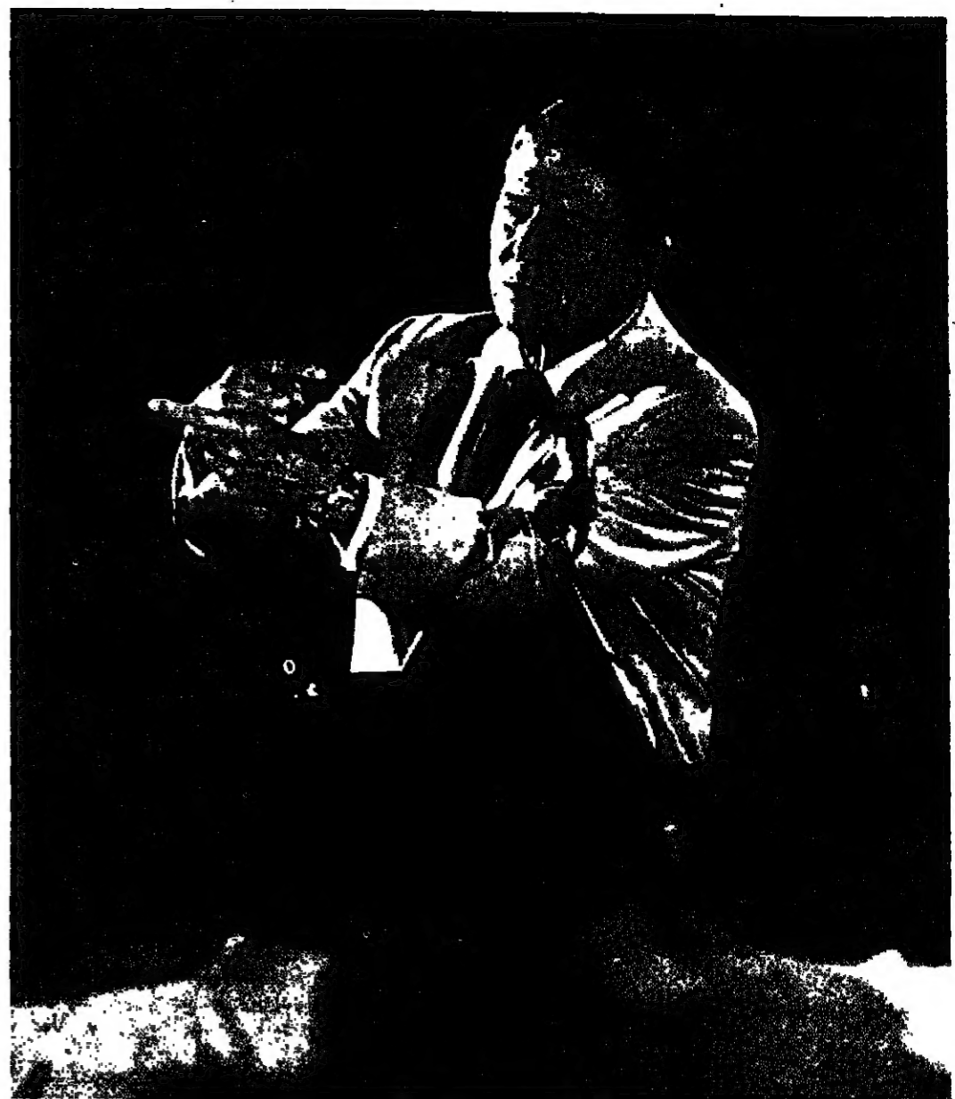
ريغان في مهرجان انتخابي